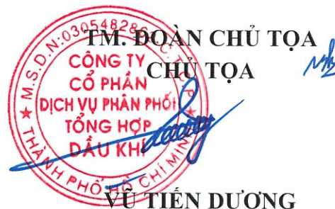
VŨ TIẾN DƯƠNG